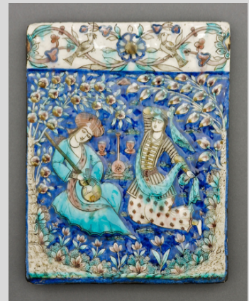
Título: Azulejo rectangular con músico y bailarín Artista: Dinastía Qajar (Siglo XIX) Lugar: Instituto de Arte de Chicago Licencia: dominio público