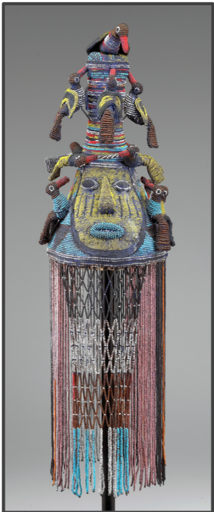
Título: Corona Yoruba Artista: Desconocido (abt. 1920) Lugar: Instituto de Arte de Minneapolis Licencia: dominio público

Para más información contacte a: Kate Stover - kate.stover@tcoe.org