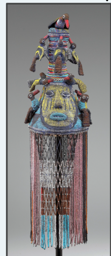
Título: Corona Yoruba Artista: Desconocido (abt. 1920) Lugar: Instituto de Arte de Minneapolis Licencia: dominio público

Para ediciones pasadas visite: https://bit.ly/ArtsAllAroundUs