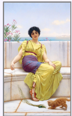
Título: Ociosidad Artista: John William Godward, (1900) Ubicación: Colección Privada Licencia: dominio público

Para ediciones pasadas visite: https://bit.ly/ArtsAllAroundUs